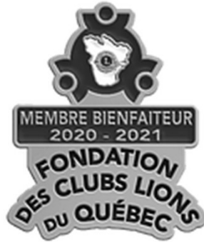
Contribution annuelle $ 20