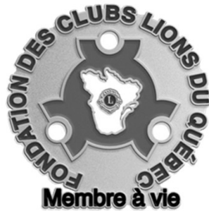
Contribution $ 75