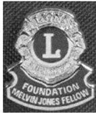
Compagnon Melvin Jones $ 1,000 US