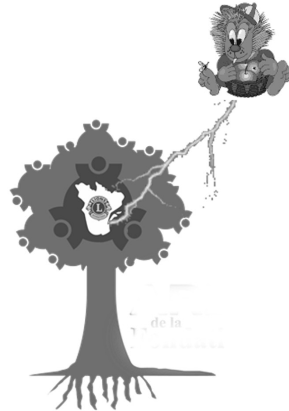
Contribution $ 250