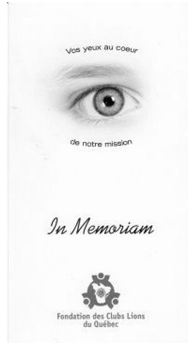
Contribution $ xxx Variable à la hauteur du donateur