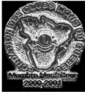
Première de la série des Bienfaiteurs