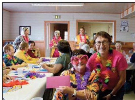
Lion Danielle et une heureuse gagnante du bingo à Miquelon

Le mois s'est poursuivi avec des actions en faveur de nos aînés menées dans le cadre de la « Semaine Bleue 2025 » : distribution de fleurs, bingo musical et collation à l'occasion d'un déplacement sur Miquelon puis un second bingo musical sur Saint-Pierre. Ambiance festive garantie !