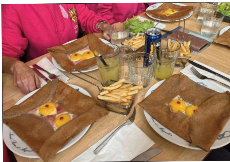
La galette « Octobre Rose »

Octobre est le mois de l'année dédié à la lutte contre le cancer du sein. Cette année encore, nous avons apporté notre soutien à cette grande cause et sommes allées déguster la galette « Octobre Rose » dans un restaurant de Saint-Pierre.