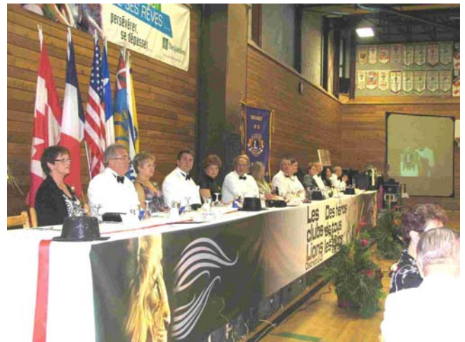
Convives de la table d'honneur

juste titre comme des Héros lors de vos interventions. Avec tout cela, vous réussirez à « émerveiller votre communauté »