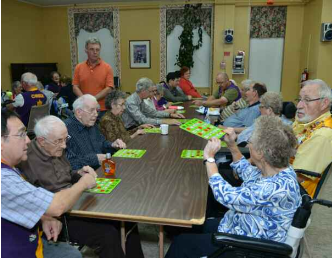
Et nous avons une gagnante!

Le 8 octobre dernier, 15 membres du club de Rivière-du-Loup ont fait jouer les résidents au bingo à l'hôpital Saint-Joseph de Rivière-du-Loup. Nous avons eu droits à tous pleins de sourire et du monde bien contents!! Normal car tout le monde gagne au moins une fois.