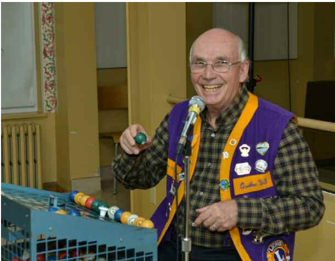
Voilà celui que tous écoutaient religieusement!