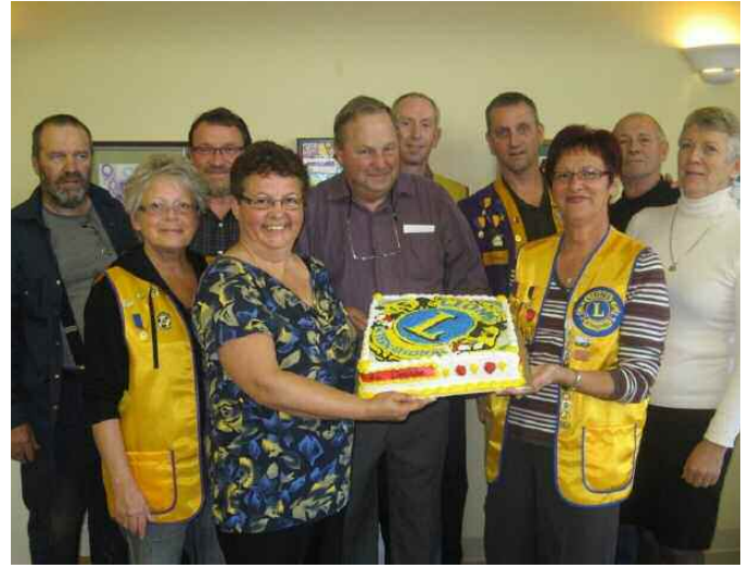
Les Lions présents avec le gâteau offert aux résidents.

Le 8 octobre, le coeur des gens de la Résidence Pierrette Ouellet, de Mont-Carmel, était à la fête. Une dizaine de membres Lions ainsi que quelques conjoints avaient organisé un après-midi musical. Cette activité fort appréciée soulignait la Journée internationale du lionisme.